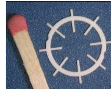
Usinage laser Thomas Sidler ⇐