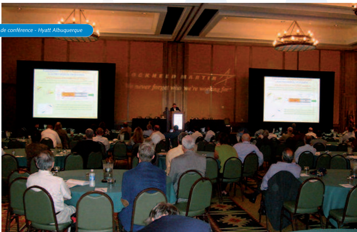
Salle de conférence - Hyatt Albuquerque

Micronarc est une initiative des Cantons de Berne, Fribourg, Vaud, Neuchâtel, Genève, Valais et Jura, soutenue par le Secrétariat d'Etat à l'économie (SECO).