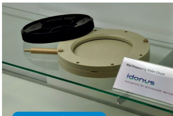
Wet Processing Wafer Chuck